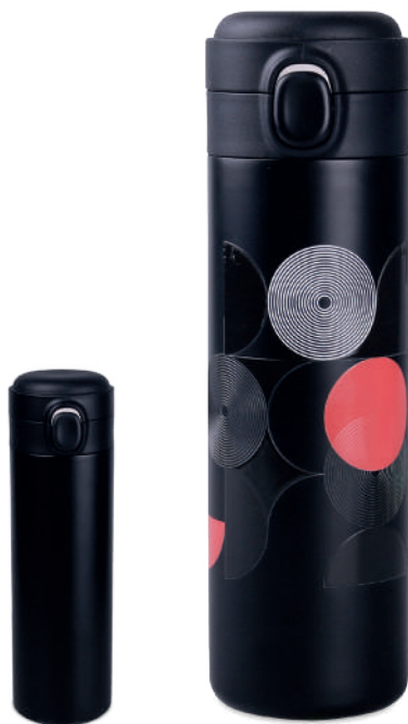
Orion 440 ml