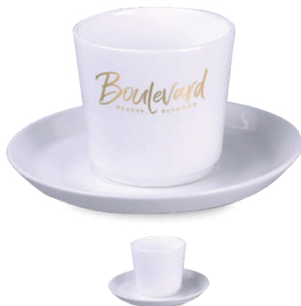
Ole Espresso Set 100 ml