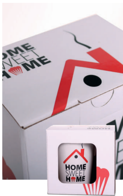
Open + P_703