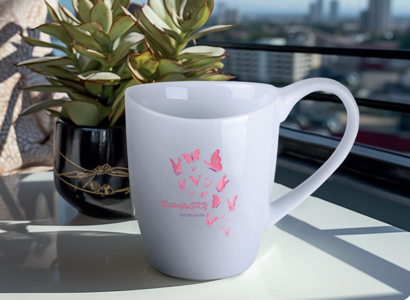
Rico Pure ® 250 ml