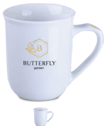
Ergo 280 ml ®