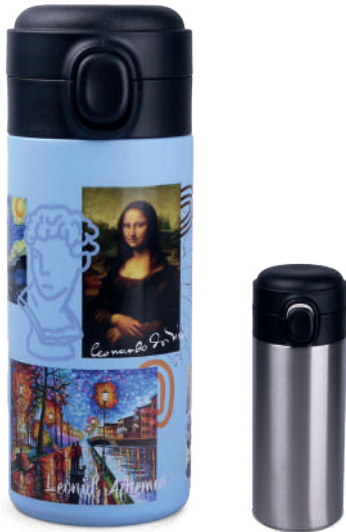
Vega 310 ml