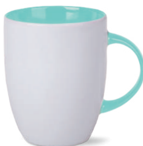
wewnątrz i ucho