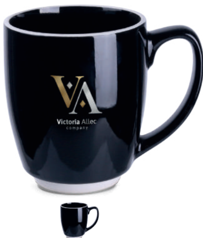
Colorado ® 350 ml