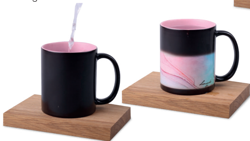
Tomek Magic 300 ml