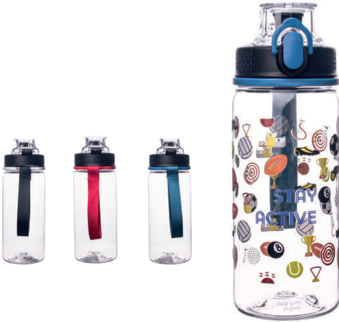
Comet 500 ml