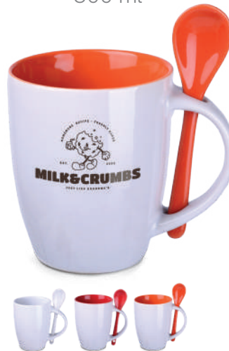
Easy 300 ml