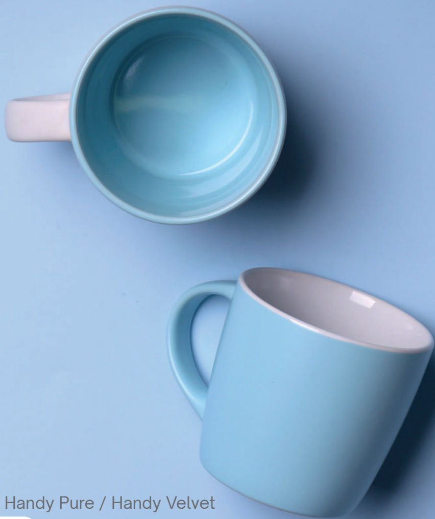
Handy Pure / Handy Velvet

Niezwykle modne kształty i fasony w połączeniu z kreatywnymi możliwościami zdobień sprawiają, że wyróżnisz swoją ofertę na tle innych.