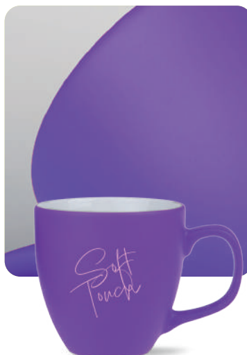
Wykończenie Soft Touch