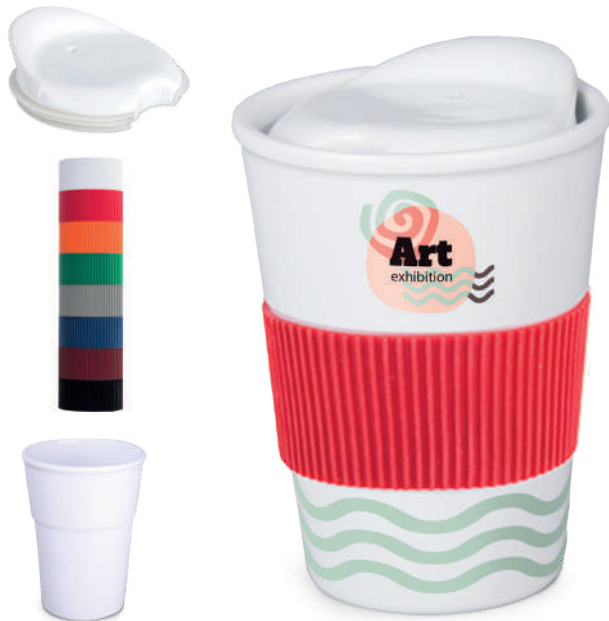
Coffee2go Trend 350 ml