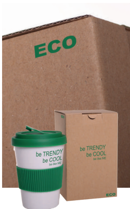
Coffee 2 Go + P_702

Zaproponuj klientowi modną wersję eco, kolorowy błysk lub mat zgody z brandingiem, albo efektowne opakowanie z nadrukiem cyfrowym .