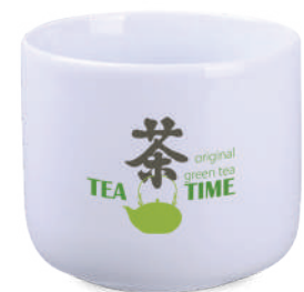
Osaka N E W 80 / 230 ml