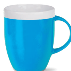
na zewnątrz (obniżony kolor rantu)