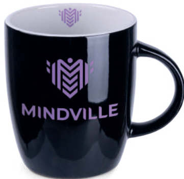
Mini Specta R 280 ml