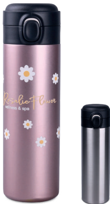
Orion Steel 440 ml