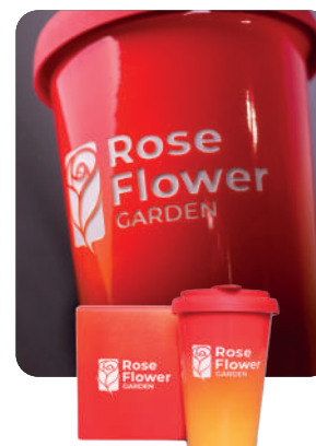
Branding kubków i opakowań