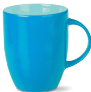
na zewnątrz i wewnątrz (różne kolory)