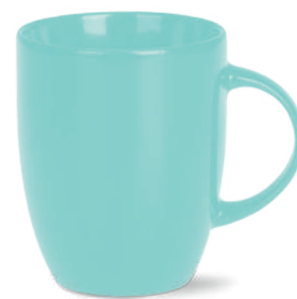
na zewnątrz i wewnątrz (ten sam kolor)