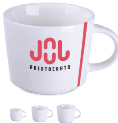
Lucas 75 / 200 / 350 ml ®