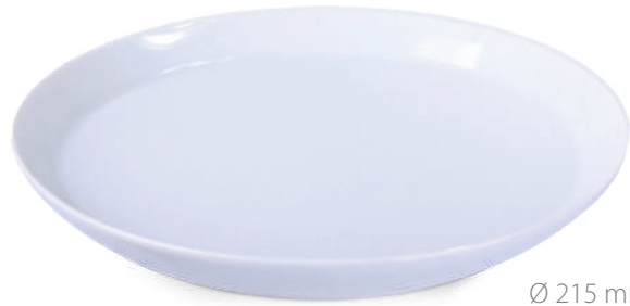
Ø 215 mm