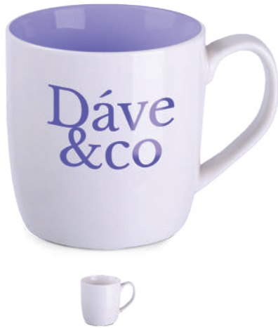
Decor 360 ml ®