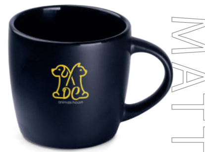
Handy Small Supreme 100 ml R