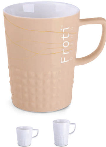
Diamond 280 / 350 ml ®