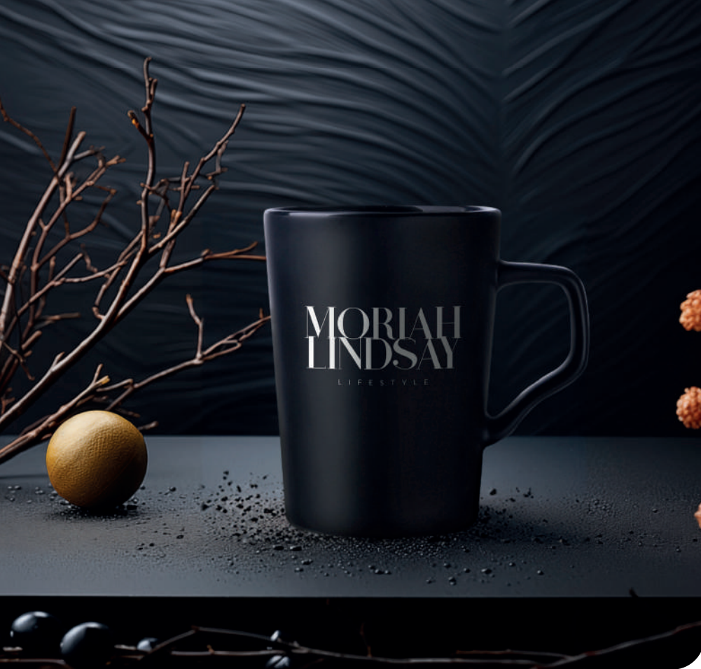
Glen Supreme ® 380 ml