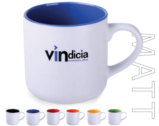
Diego Pure 350 ml