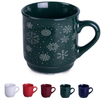
Claus 220 ml