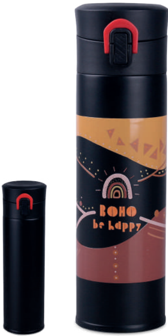
Meteor 320 ml