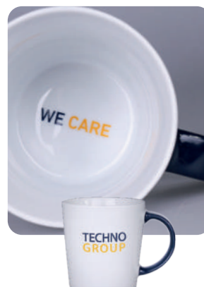
Barwienie ucha i nadruk na dnie