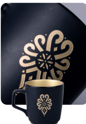
Piaskowanie z częściowym wypełnieniem kolorem