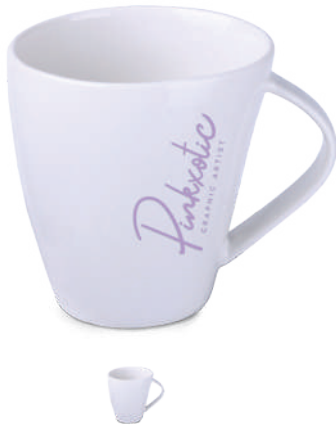
Kick 210 ml ®