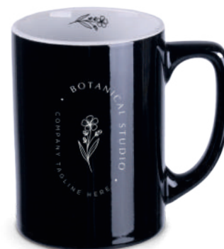
Anna 280 ml