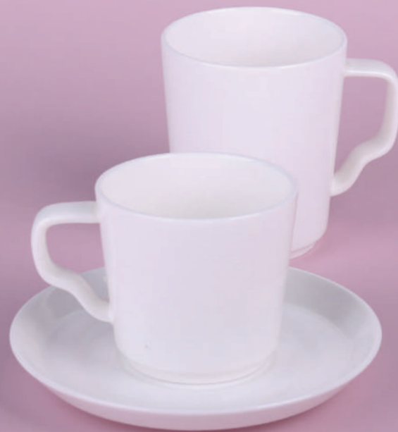
Prince / Prince Set