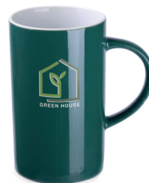
Viva 300 ml