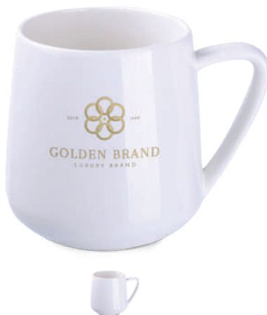
Eris 350 ml ®