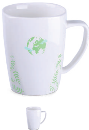
Edge 280 ml ®