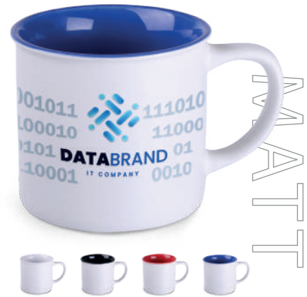
Loft Pure 310 ml