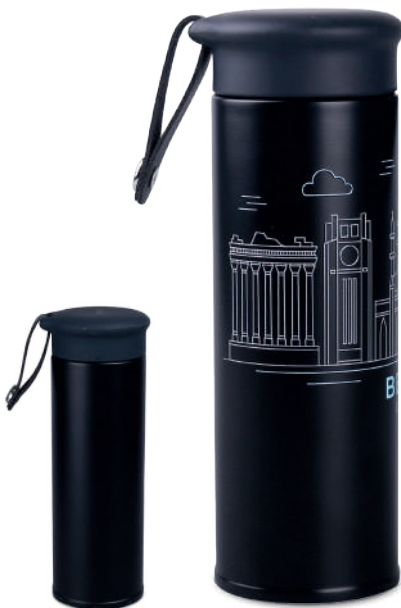
Moon 420 ml