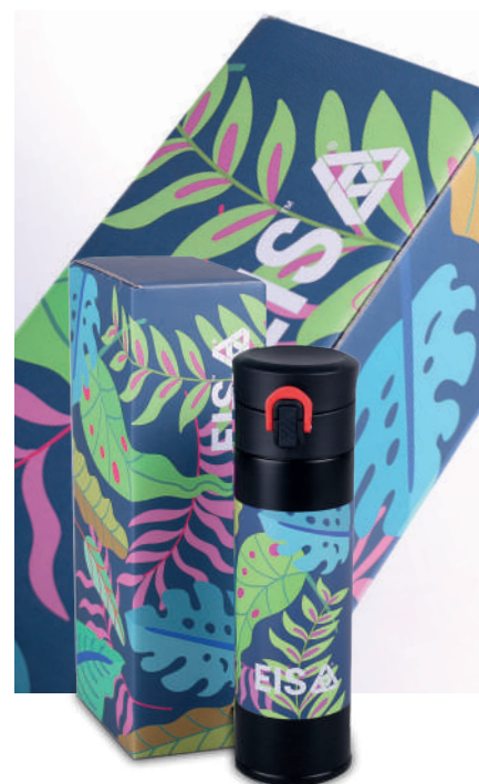
Meteor + opakowanie Galaxy