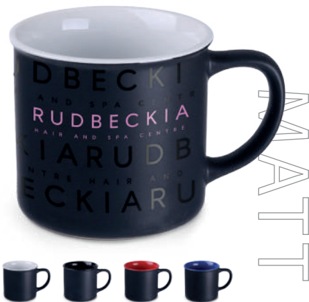
Loft Supreme 310 ml