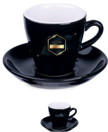
Verona Espresso Set 80 ml