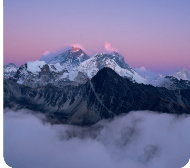
Elmo Art 160 ml

Nasze kubki sublimacyjne pozwalają przenieść na wybrany model nawet najbardziej kreatywne i wymagające projekty.