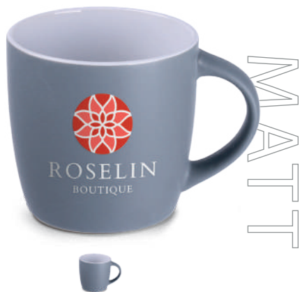
Handy Cool 320 ml R