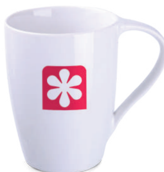
Vision ® 220 / 330 ml