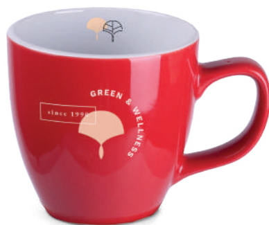
Americano Small Duo 250 ml