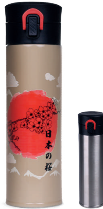
Meteor Steel 320 ml