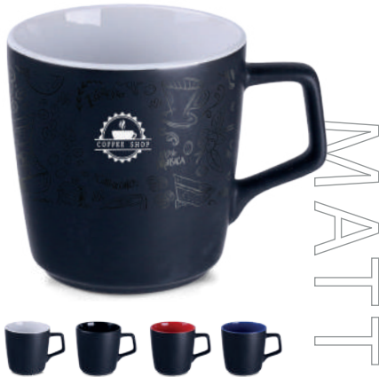
Barrel Supreme ® 300 ml