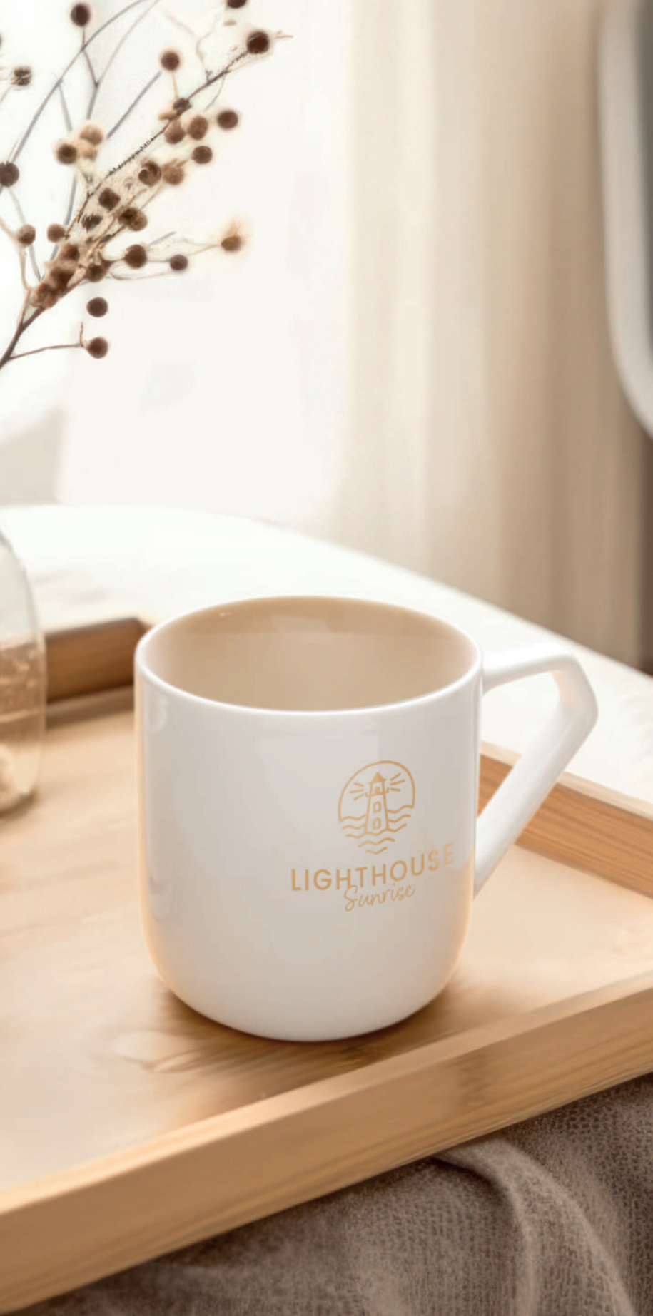
Idea ® 390 ml