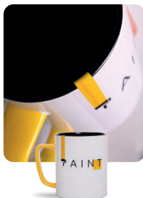
Nadruk przechodzący przez rant