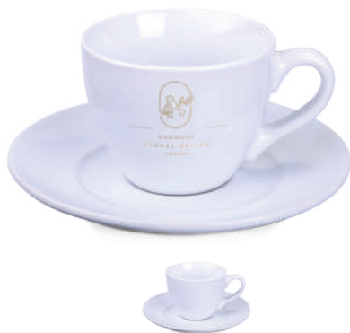
Dream Set 150 ml ®