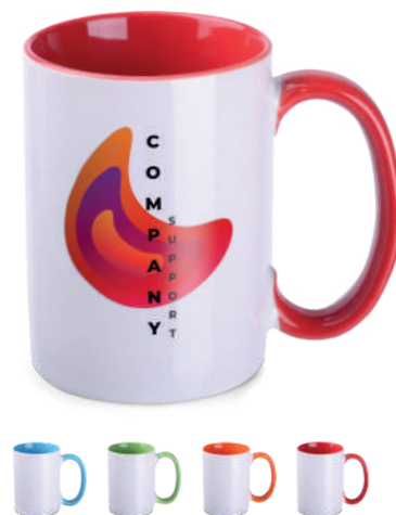
Evergreen 300 ml