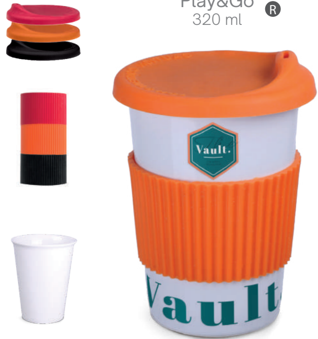
Play&Go ® 320 ml